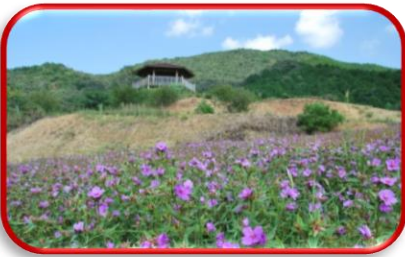
星が丘公園 ヒメノボタン (高知県絶滅危惧種)

近隣の市街地まで車で30分程度と、ほどよい田舎生活が出来ます。また、村内に診療所、県立病院も近くにあるので、生活面でも安心です。