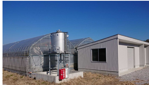
香南市の研修ハウス