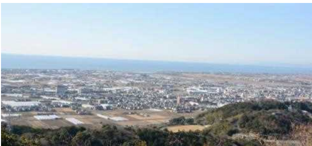
三宝山から香南市と太平洋を望む景色