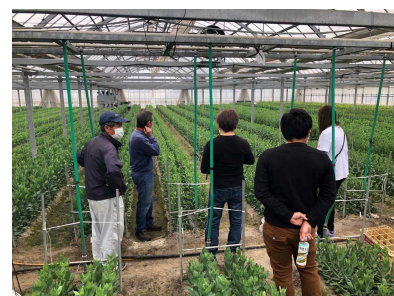
種苗会社や市場との勉強会。消費者のトレンドに合わせ、毎年新しい品種の栽培に挑戦しています。

問い合わせ先：香南市担い手育成総合支援協議会事務局（香南市農林水産課） 高知県香南市野市町西野2706番地 香南市役所5階