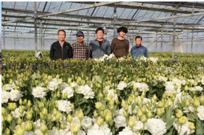
JA香美地区 マル香花き部会のメンバー