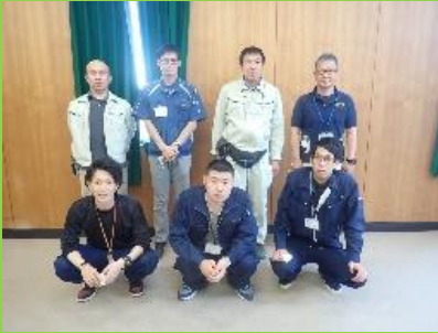
新規就農支援チーム

①本気で頑張る人を応援します。 研修中や就農後に利用できる支援 制度もあります。まずは私たちに相談 してください。