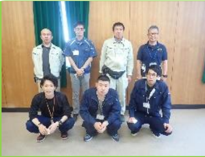
新規就農支援チーム

①本気で頑張る人を応援します。 研修中や就農後に利用できる支援 制度もあります。まずは私たちに相談 してください。