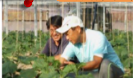
指導農業士の元で実践研修

農家研修に入る前には、きゅうり部会受入農家と関係機関と一緒に研修希望者の就農に向けた想いを伺います。