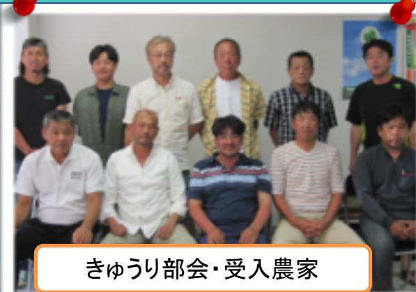
きゅうり部会・受入農家