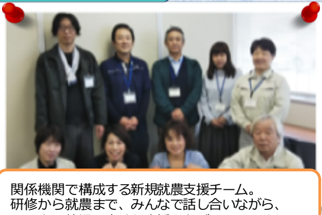
関係機関で構成する新規就農支援チーム。 研修から就農まで、みんなで話し合いながら、 その人の状況に応じた支援を心がけています。

農家研修に入る前には、きゅうり部会受入農家と関係機関と一緒に研修希望者の就農に向けた想いを伺います。