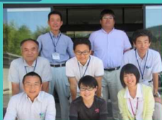
中央東農業振興センター

本気で頑張る人を応援します。研修から就農までの計画についてご相談ください。まずは私に相談してください。