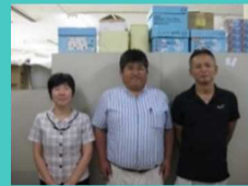
新規就農支援チーム

技術の習得や資金の確保など、就農までには様々な課題がありますが、一つ一つ乗り越えましょう。営農開始後もサポートします。