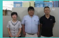
新規就農支援チーム

技術の習得や資金の確保、など、就農までには様々な課題がありますが、一つ一つ乗り越えましょう。営農開始後もサポートします。