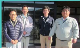
中央東農業振興センター

本気で頑張る人を応援します。研修から就農までの計画についてご相談ください。まずは私に相談してください。