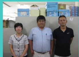
新規就農支援チーム

本気で頑張る人を応援します。研修から就農までの計画についてご相談ください。まずは私に相談してください。