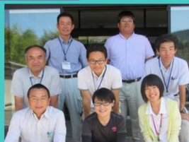
中央東農業振興センター