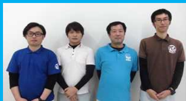
室戸市産業振興課