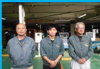
高知県農業 協同組合

各専門分野の普及指導員が営農の栽培技術、支援制度等の各段階について幅広くサポートします。経営安定に向けて課題をクリアしていきましょう！