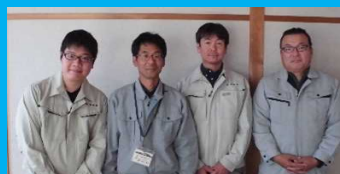
高知県安芸農業 振興センター室戸支所

研修・独立経営の各段階で利用できる支援制度もありますので、まずは気軽に私達に相談してください