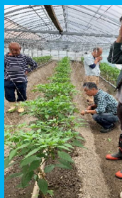
ピーマン・シトウ部会

ピーマン・シトウの収量・品質の向上を目指し、環境制御技術などの新しい技術も積極的に取り組んでいる熱意のある部会です。一緒に頑張りましょう！