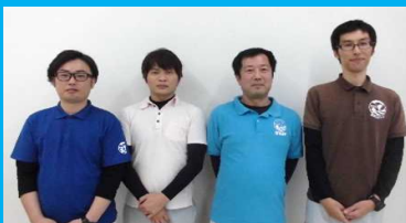
室戸市産業振興課