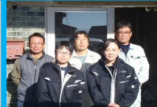
中央家畜保健衛生所 田野支所

研修・独立経営の各段階で利用できる支援制度もありますので、まずは気軽に私達に相談してください。