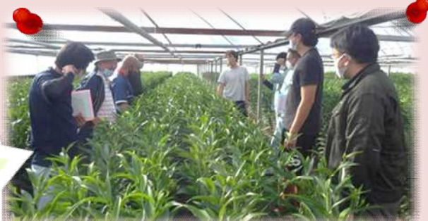
花卉部会・現地検討会の様子

就農において、人の繋がりは不可欠です。部会では、定期的に現地検討会を開催し、みんなで学び・助け合っています。