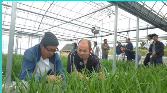
新たな技術などを取り入れている生産者圃場で勉強会をしています（現地検討会）。