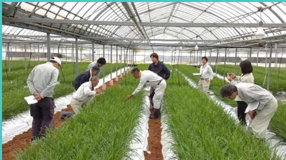
産地トップレベルの生産者（営農アドバイザー）が巡回して、栽培に関するアドバイスをしています。