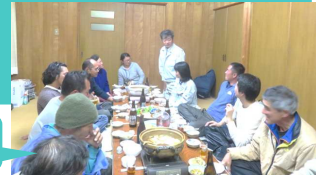
交流会もやっています