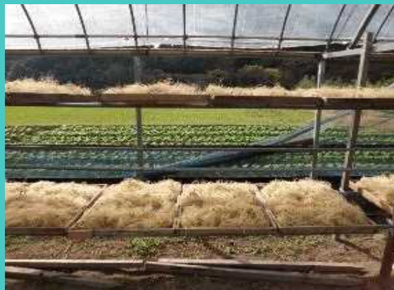
セネガの天日乾燥