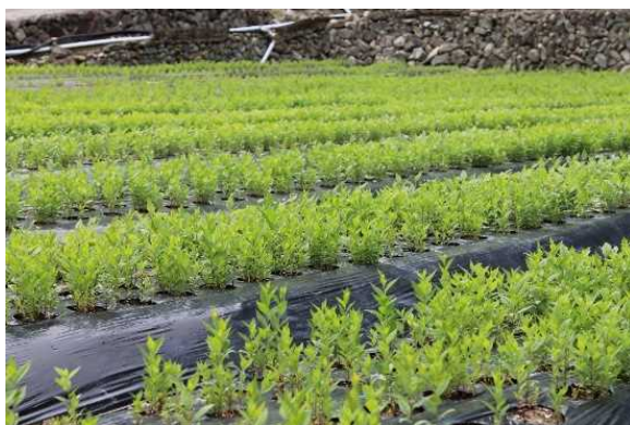
セネガの栽培状況

また、農家同士の繋がりが強く、新規就農者にはほ場づくりから収穫までベテラン農家がサポートしています。品質の高いセネガを供給することにより取引会社から信頼される産地を目指しています。