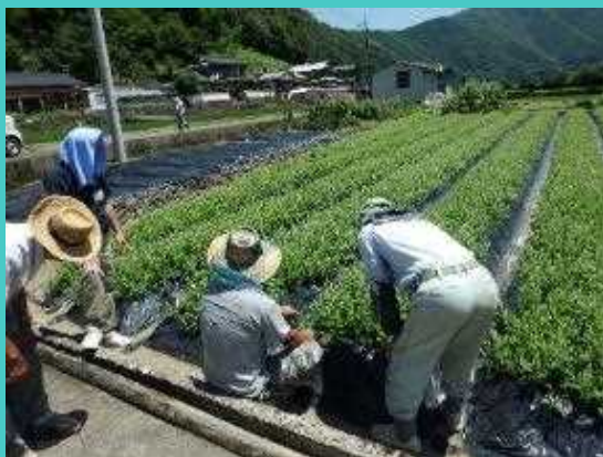
セネガ研究会のほ場研修