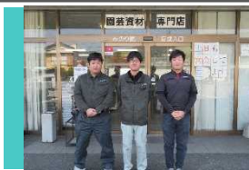
JA高知県とさし営農経済センター

農業技術や必 要知識の習得に 始まり就農に向け てサポートしてい きます。 お気軽にご相談 下さい。