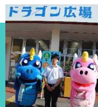
土佐市(農林業振興課)