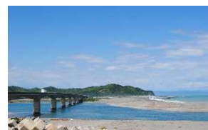
仁淀川河口の風景