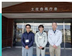
中央西農業振興センター

農業技術や必 要知識の習得に 始まり就農に向け てサポートしてい きます。 お気軽にご相談 下さい。