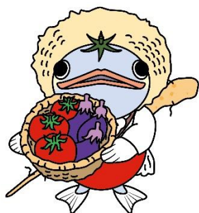
安田町イメージキャラクター