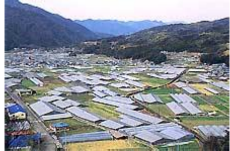
平野部に広がる園芸用ハウス

上流の中山間部では、露地野菜や柚子、自然薯（じねんじょ／やまいも）の栽培も盛んに行われています。