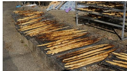
安田町の特産品じねんじょ