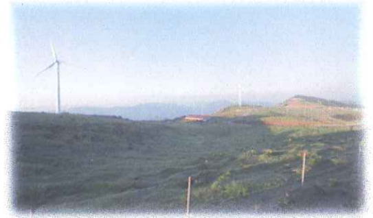
梶原町風力発電(四国カルスト)