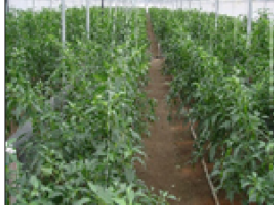
南国市のシシトウ圃場