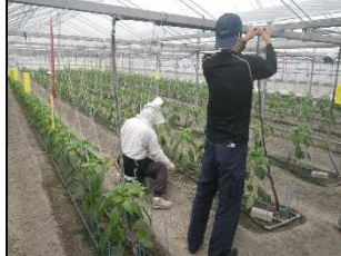
栽培初期のシシトウ圃場