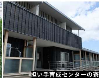
担い手育成センターの寮