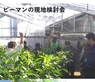
ピーマンの現地検討会