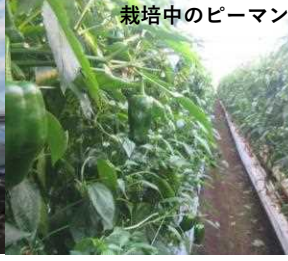
ピーマンの農業用ハウス