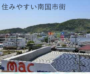
住みやすい南国市街