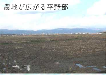
農地が広がる平野部