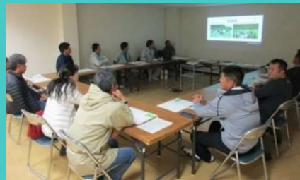
ショウガ部会による勉強会 (年間数回予定、県内外視察研修もあり)