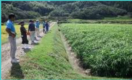
営農アドバイザー巡回によるショウガ栽培指導