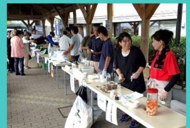
町内イベントに参加し、消費拡大に取り組んでいます。